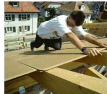
Houtvezelplaat met tand en groef

Bij houtvezelonderdakplaten kies je best voor tengellatten met een minimum hoogte van 2 cm. De platen moeten met de tand naar boven geplaatst worden om waterinfiltratie in de groef te vermijden. Ze zijn niet geschikt om langdurig blootgesteld te worden aan rechtstreekse weersinvloeden, de dakbedekking moet ten laatste na 6 weken geplaatst worden.