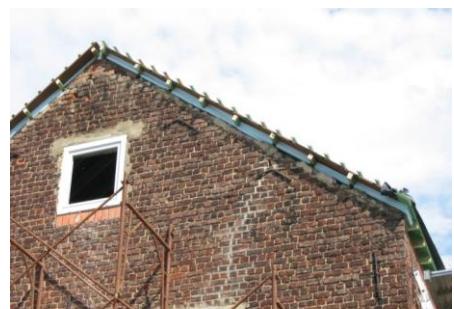
Koudebruggen wegwerken ter hoogte van de tipgevels