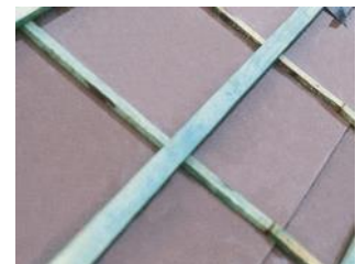
Onderdak in vezelcementplaten

Vezelcementplaten zijn stijve, geperste platen van 3 mm dik. Ze worden gemaakt van cement, organische en synthetische vezels en minerale toeslagstoffen. Ze zijn voldoende dampopen ( S_d = \pm 0,25 m) en capillair. Net zoals folies worden de platen met een overlapping geplaatst, die afgekleefd moeten worden om voldoende winddichting te garanderen. Een dunne stijve plaat is meestal niet perfect vlak, wat maakt dat twee platen onderling moeilijk perfect winddicht afgekleefd kunnen worden, wat ze toch minder geschikt maakt voor gebruik als onderdak. Dubbel geperste vezelcementplaten zijn iets minder dampopen ( \mu_d = \pm 0,4 m), maar vormvaster en dus iets eenvoudiger winddicht af te kleven. Vezelcementplaten worden zelden nog gebruikt voor nieuwe onderdaken maar komen we wel nog tegen in bestaande daken. Deze vezelcementplaten kunnen asbest bevatten. Het is verboden om asbesthoudende materialen te beschadigen (breken, afschuren of naar beneden gooien) omdat dit asbeststof kan veroorzaken. Bij (renovatie)werken ben je als eigenaar verplicht om asbesttoepassingen die eenvoudig bereikbaar zijn te verwijderen. Dergelijke platen zijn bijgevolg niet geschikt om in te slijpen en worden best ook niet beschadigd om geen asbest vrij te laten komen."