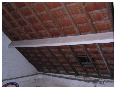
Bestaand hellend dak zonder onderdak

Bij nieuwe hellende daken wordt altijd een onderdak geplaatst. Bij bestaande daken is vaak geen onderdak aanwezig. Bij een aan de binnenzijde niet afgewerkt dak, is de aanwezigheid van een onderdak eenvoudig vast te stellen: kun je van op de zolder de dakpannen zien, dan heb je te maken met een dak zonder onderdak. Bij een dak dat wel aan de binnenzijde volledig is afgewerkt is dat vaak moeilijker. Enkel door het oplichten van enkele pannen of door het verwijderen van een deel van de binnenbekleding, kan je dit nagaan. Een geschikt onderdak in goede staat is een essentieel onderdeel van een dak. Isoleren van een hellend dak zonder of met een beschadigd of ongeschikt onderdak houdt risico's in.