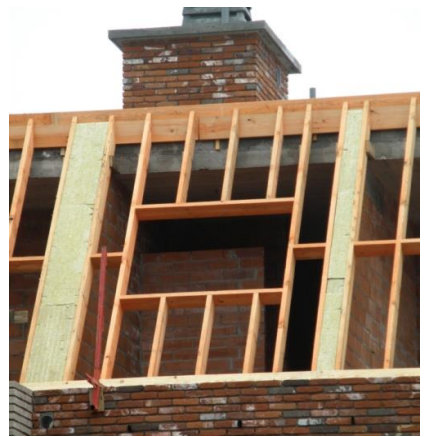
Stroken isolatie tussen onderdak en metselwerk