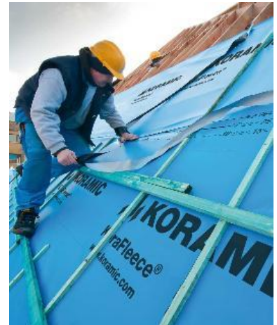
Onderdakfolie met geïntegreerde kleefstrook

De stroken onderdakfolies worden met een overlapping geplaatst. Enkel wanneer de overlappingsen afgekleefd worden, vooraleer de tengellatten geplaatst worden, kan een winddichte uitvoering gerealiseerd worden. Sommige onderdakfolies zijn beschikbaar met een geïntegreerde kleefstrook, wat het winddicht maken sterk vereenvoudigt.