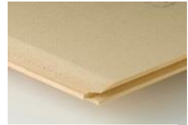
Onderdak in houtvezelplaten

Houtvezelonderdakplaten worden gemaakt van houtrestanten, waarbij het in het hout aanwezige hars als bindmiddel dient. Om de platen waterdicht te maken, worden ze behandeld met een mengsel van water en bitumen of met latex. De platen zijn capillair en dampdoorlatend ( S_d = 0,10 tot 0,25 m). Hun tand- en groefverbinding verzekert de goede winddichtheid ter hoogte van de aansluitingen tussen twee platen waardoor het afkleven beperkt kan blijven tot de verbindingen zonder tand- en groef (bv. ter hoogte van de nokken, dakdoorvoeren of dakvlakramen). De platen zijn daarenboven isolerend ( \lambda = 0.046 à 0.055 W/m 2 K), waardoor ze de koudebrugwerking ter hoogte van de kepers of sporen verminderen. Standaard hebben ze een dikte van 18 of 22 mm. In grotere diktes worden ze soms gebruikt als buitenste isolatielaag bij sarkingdaken uit houtvezelisolatieplaten.