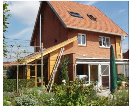
Voorzie een dakoversteek bij het vernieuwen van het dak