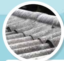
GOLFPLAAT Asbestcementen golfplaat van ongeveer 5 mm dikte. Lichtgrijs of gekleurd (zwart of rood).