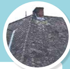
DAKLEIEN Vlakke kunstleien in asbestcement. Grijs materiaal, maar aan de buitenkant vaak zwart of rood gekleurd.