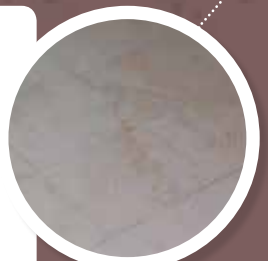
VLOERTEGELS Harde, dunne, meestal gevlamde tegels in asbesthoudend vinyl. Breken bij buiging. Vaak bevestigd met asbesthoudende lijm. Opgelet: soms is niet de tegel maar het onderliggend 'karton' asbesthoudend!