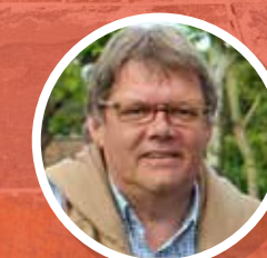
Ludwig Vandenhove gedeputeerde van Leefmilieu Provincie Limburg