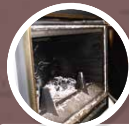
AFDICHTINGSKOORD Wit tot grijs pluizig koord. Valt zeer makkelijk uiteen. Bij kachels en verwarmingsketels vaak als afdichting van schoorsteen, uitlaat, ruit of deurtje gebruikt.