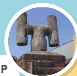
SCHOUWPIJP Ronde of vierkante buizen in grijs asbestcement.