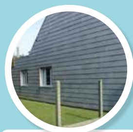
GEVELLEIEN Vlakke kunstleien in asbestcement.