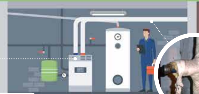
PLAASTERISOLATIE Brokkelig plaaster rond verwarmingsleidingen met weinig tot zeer veel vezels. Meestal omwikkeld met wit jute doek.