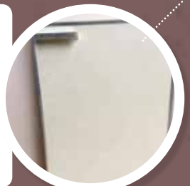
GLASAL-TOEPASSING Vlakke plaat in asbestcement met een gladde harde bovenlaag. Uitgevoerd in verschillende kleuren. Vaak in keukenmeubelen.