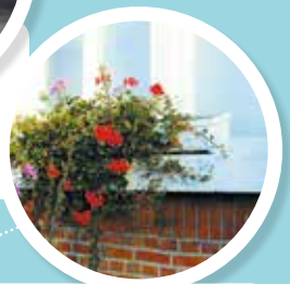
BLOEMBAK Vrij dunne asbestcementen bakken in diverse vormen. Grijs, maar vaak ook wit gekleurd.