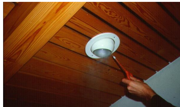
Luchtlekken opsporen door met een rookstaafje langs kritieke punten (aansluitingen met het schrijnwerk, contactdozen in buitenwanden...) tijdens het uitvoeren van een luchtdichtheidstest (meting onderdruk).

Hoe goed of hoe slecht een gebouw luchtdicht is kan dus aangetoond worden met een luchtdichtheidstest. Wanneer we de plaats van eventuele luchtlekken willen bepalen dan kan dat met een thermografische camera of met rookstaafjes, idealiter tijdens het uitvoeren van de meting wanneer de woning in onderdruk wordt gezet. De binnenkomende lucht voelt aan als tocht.